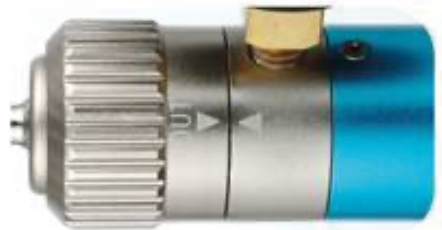
2.2 Pressure pump